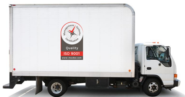
Slika 5. Primer upotrebe novog znaka sertifikacije na transportnom sredstvu

MSCertification d.o.o. će sprovesti odgovarajuću kontrolu svojine i preduzimati mere prema nekorektnom pozivanju na status sertifikacije ili dvosmisleno upotrebu znakova sertifikacije i simbola akreditacije ili izveštaja sa provere. U slučaju narušavanje neke od prethodno navedenih odredbi, sertifikaciono telo zadržava pravo pokretanja zahteva za korekciju i korektivne mere, suspenziju sertifikacije, povlačenje sertifikacije, objavljivanje prekršaja i, ukoliko je to potrebno, pravne mere.