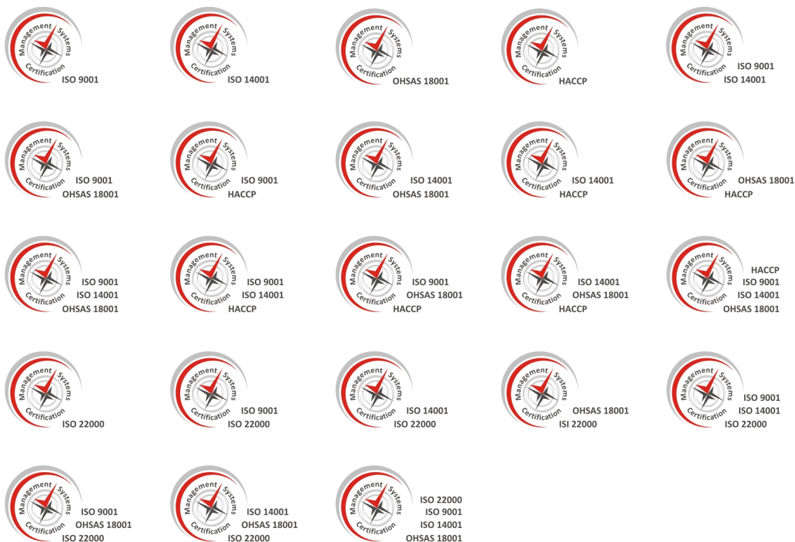
Slika 6. Stari znakovi sertifikacije za sisteme menadžmenta i HACCP sistem