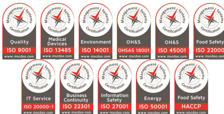
Slika 7. Novi znakovi sertifikacije za sisteme menadžmenta i HACCP sistem