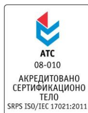
Slika 3. Simbol akreditacije

Sertifikovan klijent ima pravo na upotrebu samo onih znakova sertifikacije i simbola akreditacije (forma, oblik i sadržina) koji su dostavljeni od strane sertifikacionog tela MSCertification d.o.o.